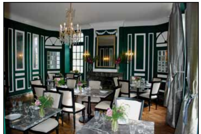
Figure bien connue dans le monde de la grande cuisine américaine, il a été finaliste de la saison 4 de la célèbre émission de télévision Top chef américain. Les travaux d'aménagement du restaurant viennent de se terminer.